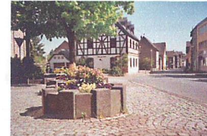
Nickenich an der Linde

Abtei Sayn, Eisengussmuseum Sayn, Schmetterlingsgarten und Eisengussmuseum in Bendorf-Sayn Deutsches Bimsmuseum, Kaltenengers und der Pellenzort Nickenich Museums-Lay-Lavakeller-Vulkanbrauerei, Mendig